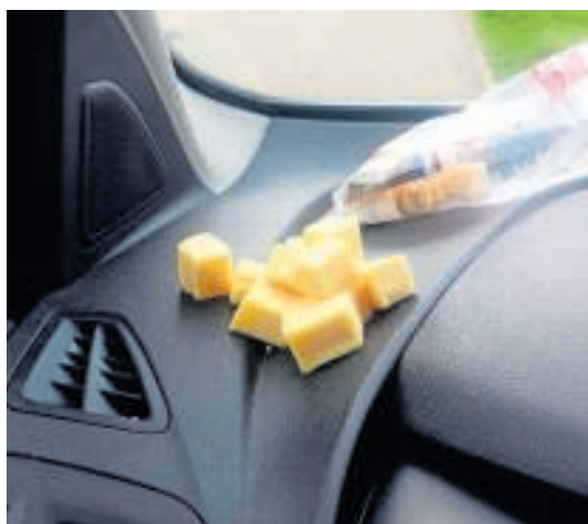
▲ Ruben Planting maakt kunst van alledaagse objecten.